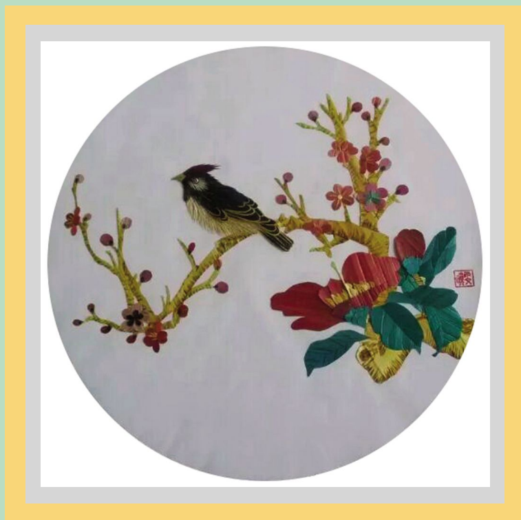
麦秸画 作者:张小文(兰州市)