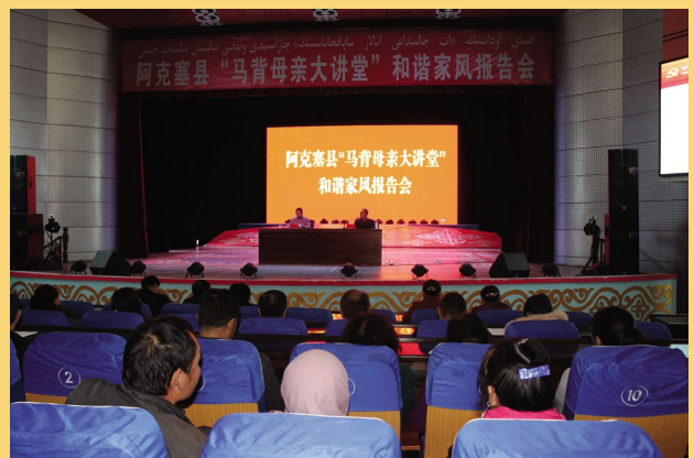
阿克塞妇联举行“马背母亲大讲堂”和谐家风报告会。

新年伊始，各地妇联以夫妻和睦、尊老爱幼、科学教子、邻里互助、礼仪文明、院落布设、衣着打扮、疾病预防、改厕改水等家庭美德教育和人居环境改善为主要内容，开展“母亲讲堂”、“文明家风大讲堂”等家庭教育活动，大力传播好家风好家训，进一步提升村民综合文明素质，鼓励引导群众弘扬中华民族传统美德和优良品质。