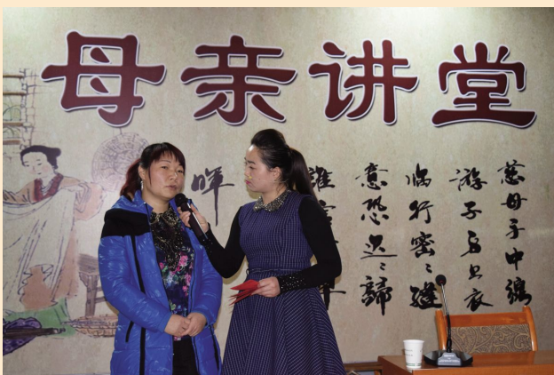
肃北县妇联举办“注重家庭、注重家风、注重家教”“草原母亲文化大讲堂”专题讲座。

新年伊始，各地妇联以夫妻和睦、尊老爱幼、科学教子、邻里互助、礼仪文明、院落布设、衣着打扮、疾病预防、改厕改水等家庭美德教育和人居环境改善为主要内容，开展“母亲讲堂”、“文明家风大讲堂”等家庭教育活动，大力传播好家风好家训，进一步提升村民综合文明素质，鼓励引导群众弘扬中华民族传统美德和优良品质。