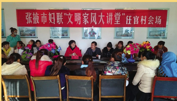
张掖市妇联“文明家风大讲堂”入村入社区活动受群众欢迎。