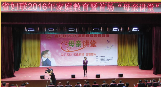
省妇联 2016 家庭教育暨首场“母亲讲堂”开讲。