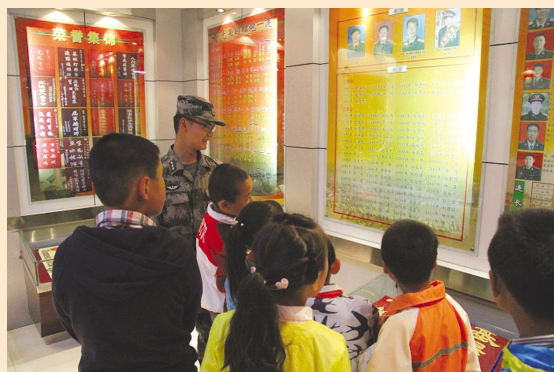
嘉峪关妇联与部队携手庆“六一”

在“六一”儿童节来临之际，全省各级妇联充分发挥妇联情系儿童成长、保护儿童权益的职责，积极开展了丰富多彩的慰问活动，为广大儿童送去节日的问候和诚挚的祝福，使全省少年儿童特别是贫困、流动、留守儿童真正享受到社会大家庭的温暖和关爱，度过了一个快乐、健康、有意义的节日。