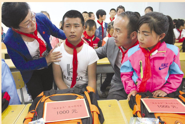
环县妇联为 12 名孤残、智障、单亲儿童送去“六一”祝福

在“六一”儿童节来临之际，全省各级妇联充分发挥妇联情系儿童成长、保护儿童权益的职责，积极开展了丰富多彩的慰问活动，为广大儿童送去节日的问候和诚挚的祝福，使全省少年儿童特别是贫困、流动、留守儿童真正享受到社会大家庭的温暖和关爱，度过了一个快乐、健康、有意义的节日。