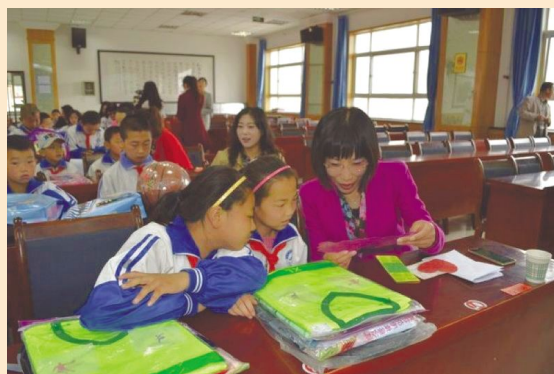
静宁县妇“爱心妈妈”和留守儿童共庆“六一”