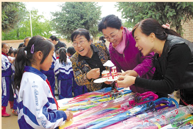
庆阳市妇联开展跳蚤市场义卖联欢活动庆“六一”