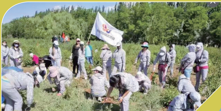
▲金昌市妇联组织巾帼志愿者集中整治环境卫生