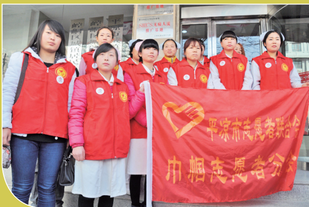
▲平凉市、崆峒区妇联联合开展“送温暖、献爱心”巾帼志愿者活动