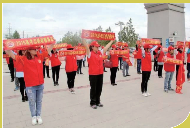
▲敦煌市巾帼志愿者参与高考服务

在持续开展“践行雷锋精神·百万巾帼志愿者在行动”、“邻里守望·姐妹相助”等专项巾帼志愿服务活动的基础上，全省各级妇联创造性地开展了符合地方特色的巾帼志愿服务活动。目前，全省各级在册巾帼志愿者达10.3万人，共组建队伍3510支，服务涉及30多个领域，巾帼志愿服务已成为妇联组织践行群众性的有力手臂。