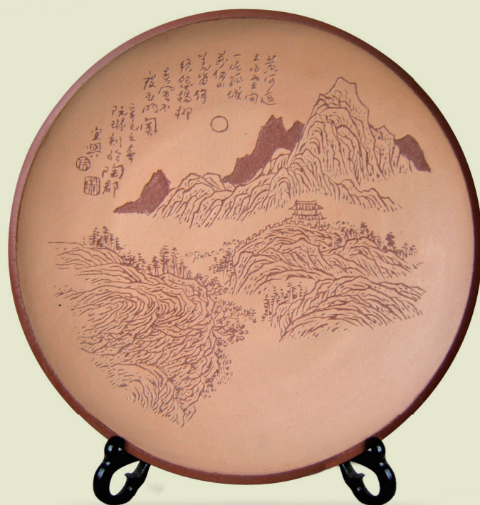
刻盘 作者 阮琳（兰州）