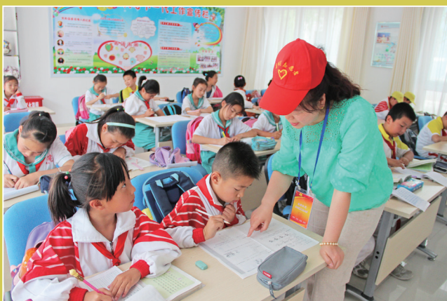
▲嘉峪关市长城区巾帼志愿者参加青少年“第二课堂”活动